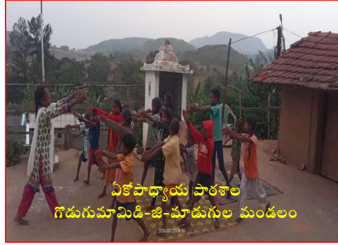
ఏకోపాధ్యాయ పాఠశాల గడుగుమామిడి-జి-మాడుగుల మండలం